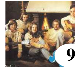
9 Small Town Singers