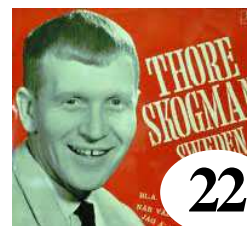
22 Thore Skogman