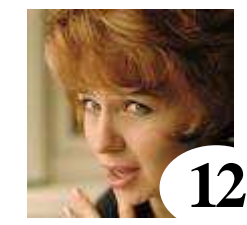
12 Anita Lindblom