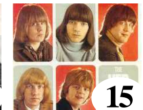
15 Hep Stars