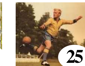
25 Nacka Skoglund