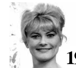
19 Monica Zetterlund