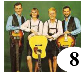
8 Family Four