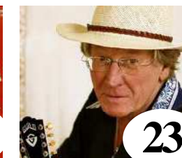
23 Sveriges Jazzband