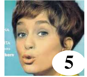
5 Siw Malmkvist