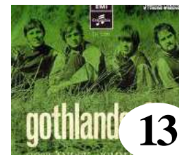
13 Gothlands Får