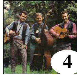
4 Jailbird Singers