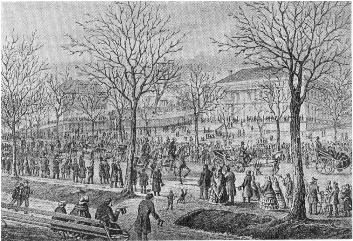
Första maj 1857 på Slätten. Litografi, Illustrerad Tidning

Nu åren flyktat, de svunnit har och under tiden han blivit far, men får jag fatt´in jag slår min klo i både honom och Bellmansro.